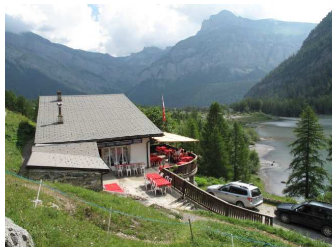
Ankunft in Derborence