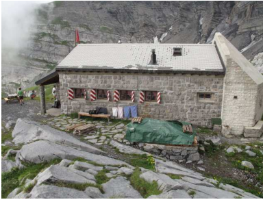
Klassische Steinhütte mit gemütlichem Innenleben und Einem herzlichen Hüttenwart.