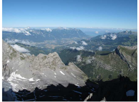
Herrliche Fernsicht ins Rhonental