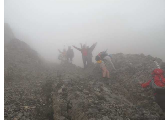
Mit viel Humor meistert unsere Gruppe den Abstieg vom Col des Chamoise

Ich erreiche mit Alex als letzter die Hütte und habe mir vorgenommen, noch den Einstieg zum Couloir zu erkunden. Ich laufe von der Hütte in Richtung Le Pacheu und steige auf tief zerspaltenen grau-weißen, mit kugeligen Steinen gespickten Platten auf ihren höchsten Punkt und erreiche den Zustieg, der zu einem grossen Firnfeld führt. Sie unterscheiden sich stark von den übrigen Felsen und wieder erkenne ich schwarzes Gestein. Ein sonderbarer Kontrast inmitten alpiner Umgebung. Südlich öffnet sich das Gebirge und wir sehen tief in das weite Rhonental. Ein Gefühl von Freiheit und Zufriedenheit umgibt mich, während ich meine Erkundung fortsetze.