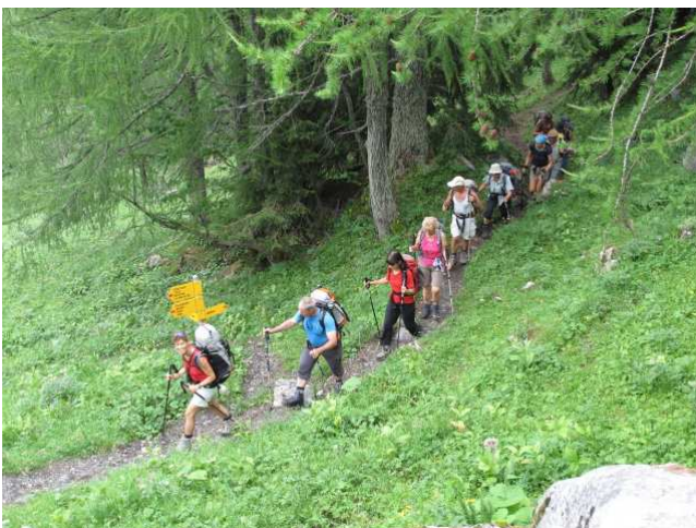
Aufstieg zur Alp Les Penes