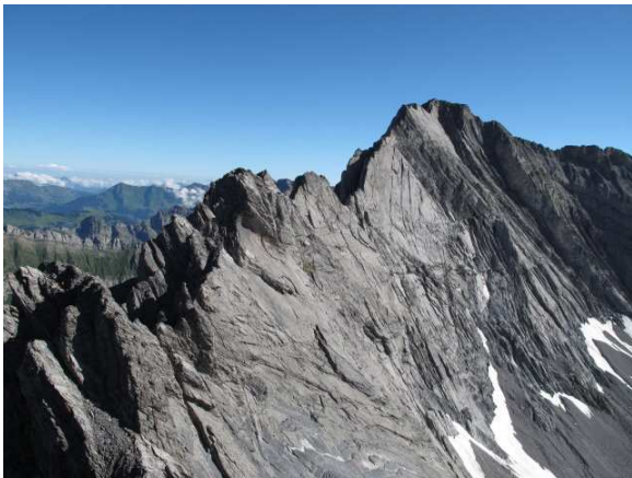
Dieser Grat, der sich zum Tita Naire erhebt Ist sehr einladend zum klettern.