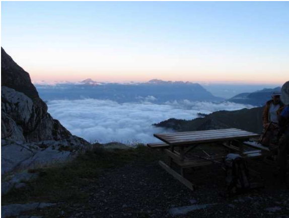
Bezaubernde Morgenstimmung vor der Hütte