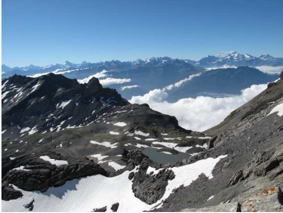
Im Fordergrund Lac Forcla, im Hintergrund Der Grand Combin.