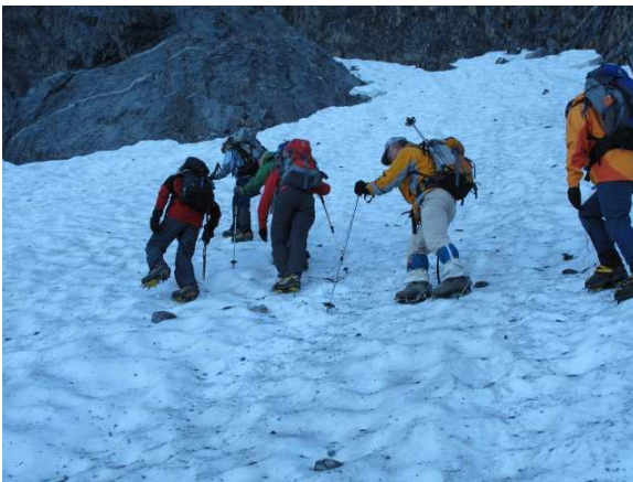
Steiler Aufstieg, bis sich das Firnfeld oben Nach links in das Couloir hinein zieht.