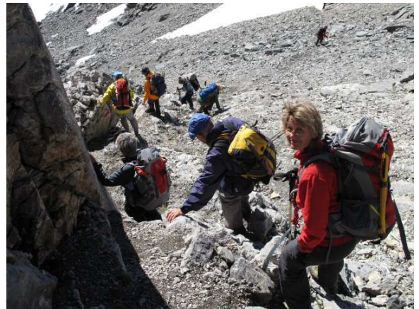
Abstieg zum Lac Forcla

Der Abstieg zum Lac Forcla verlangt nochmals Konzentration. In steilem Geröll am Anfang, später traversierend, steigen wir in die schöne Ebene des Lac Forcla ab. Die Luft ist merklich wärmer geworden. Nach einer kurzen Kleidererleichterung zeigt uns Silvia nochmals zwei Varianten für die Weiterreise auf. Wir entscheiden für die kürzere, die sich am Schluss doch noch als sehr gehaltvoll erwies.