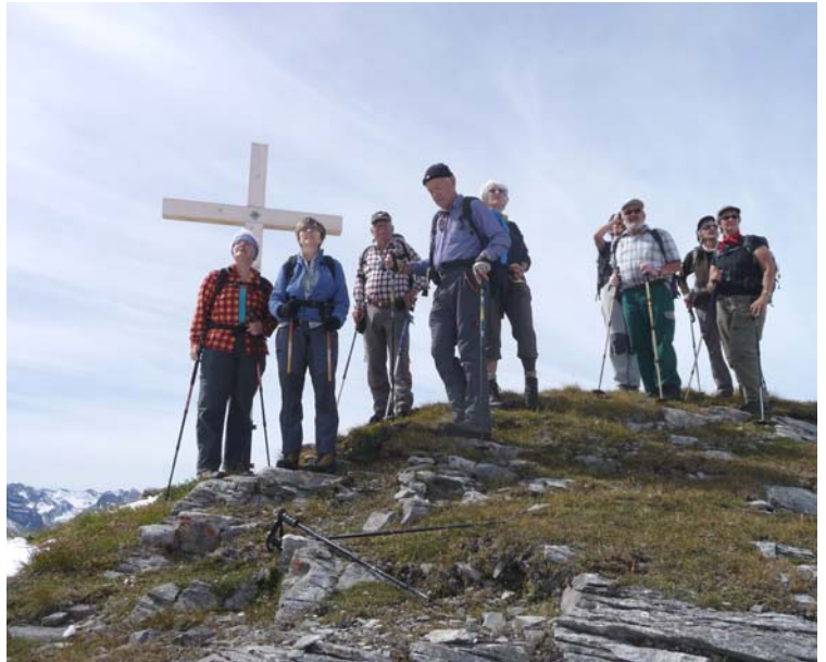
auf dem Muot da l'Hom